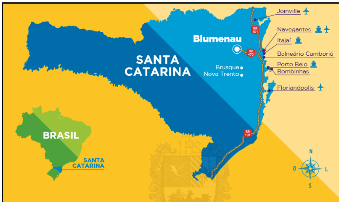
Figura 7 - Estado de Santa Catarina